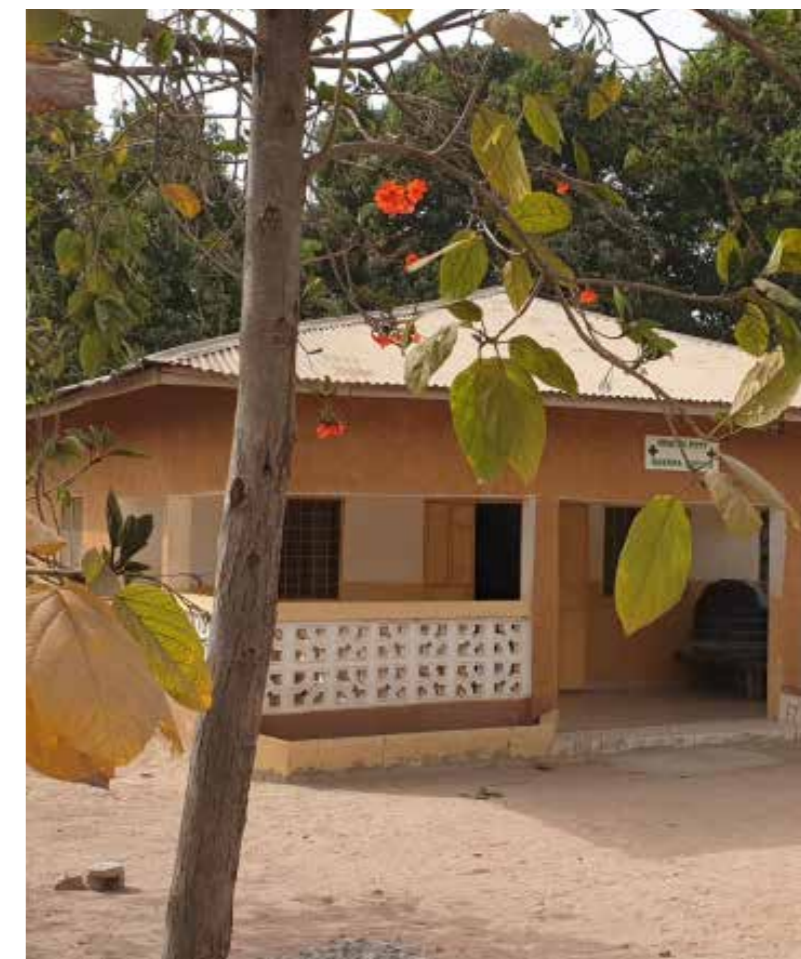
Foto: Medische hulppost in Naneto Seyon.