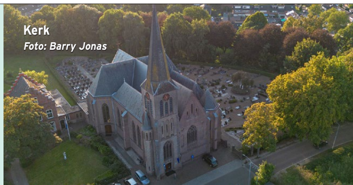
Kerk