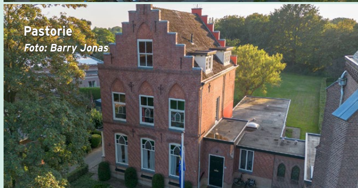
Pastorie