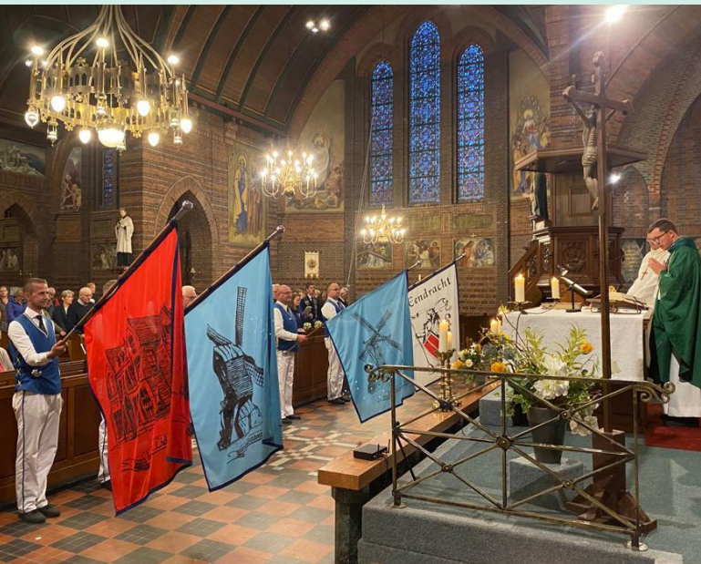
Saluut door vendeliers Schutterij De Eendracht