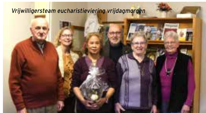
Vrijwilligersteam eucharistieviering vrijdagmorgen

Locatieraad Doetinchem.