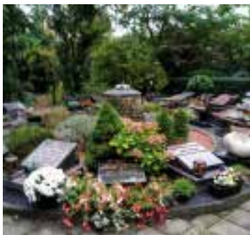
Jos Brugman.

Beheerder van het kerkhof is Bart Stevens, bijna dagelijks aanwezig. Hij kan u alles vertellen wat u weten wilt aangaande plaatsing en onderhoud van een graf. Bart is telefonisch bereikbaar via telefoonnummer: 06 - 22 15 12 21. Het kerkhof is dagelijks geopend. U kunt rustig eens binnenlopen om u te oriënteren.